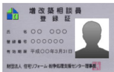
増改築相談員登録カード (顔写真入り免許証タイプ)